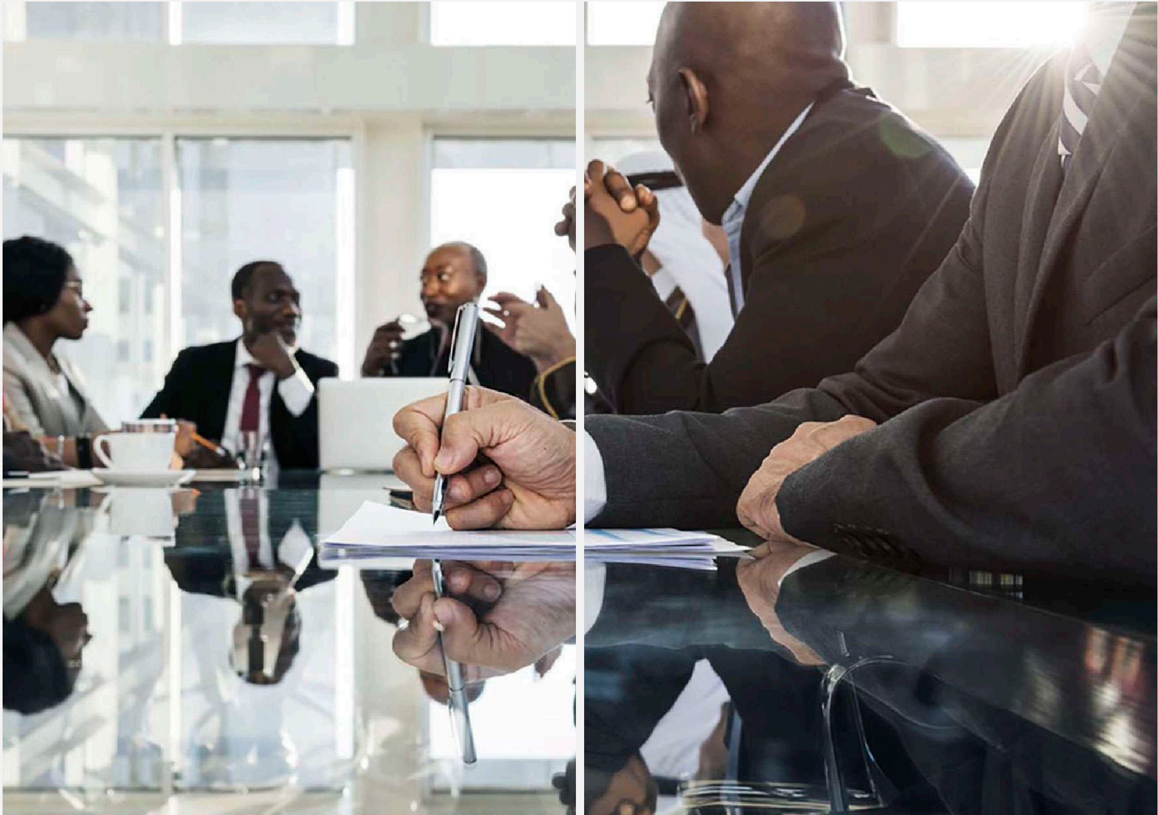
Double spread photo overlap